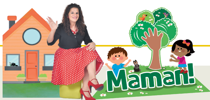
Progjet promovût di 'La Vôs dai Furlans' e 'ARLeF'