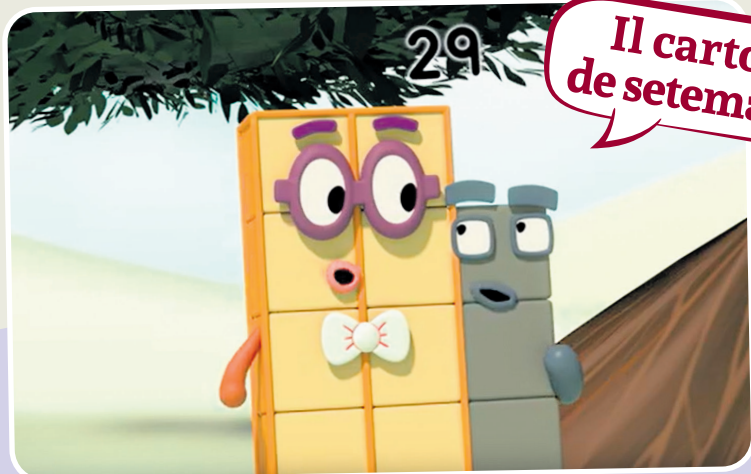
Il carton de setemane

E je la zornade dai clubs e par fâ fieste i Numaruts si cjamin par une mirinde sul prât! I clubs a son tancj, cemût fasaraial Vincjenûf a cjamâ il so?