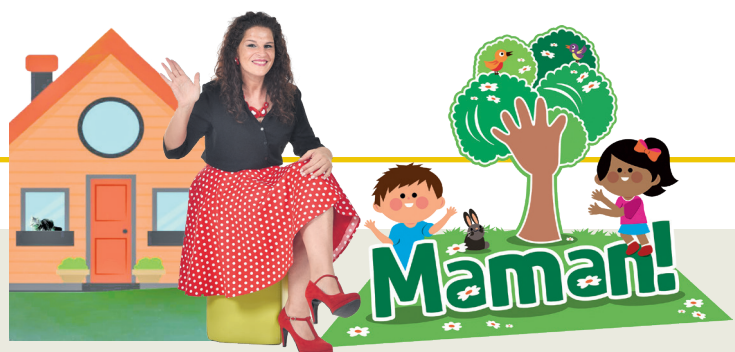
Projet promovût di 'La Vôs dai Furlans' e 'ARLeF'