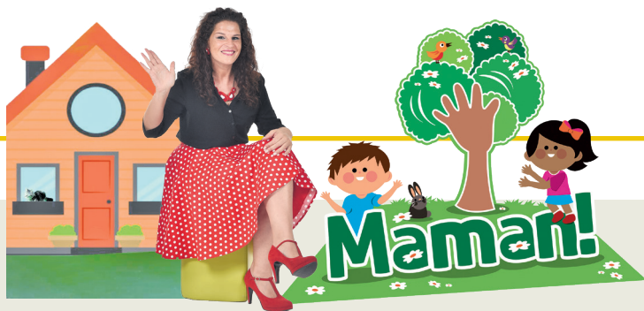
Projet promovût di 'La Vôs dai Furlans' e 'ARLeF'