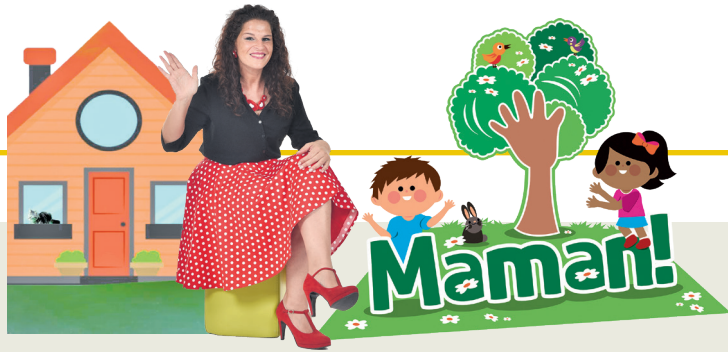
Projet promovût di 'La Vôs dai Furlans' e 'ARLeF'