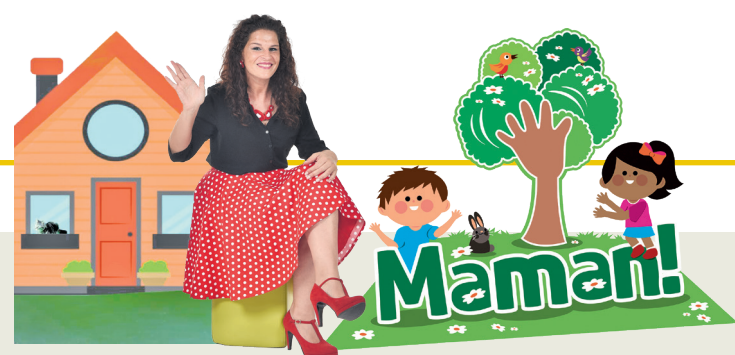
Projet promovût di 'La Vôs dai Furlans' e 'ARLeF'