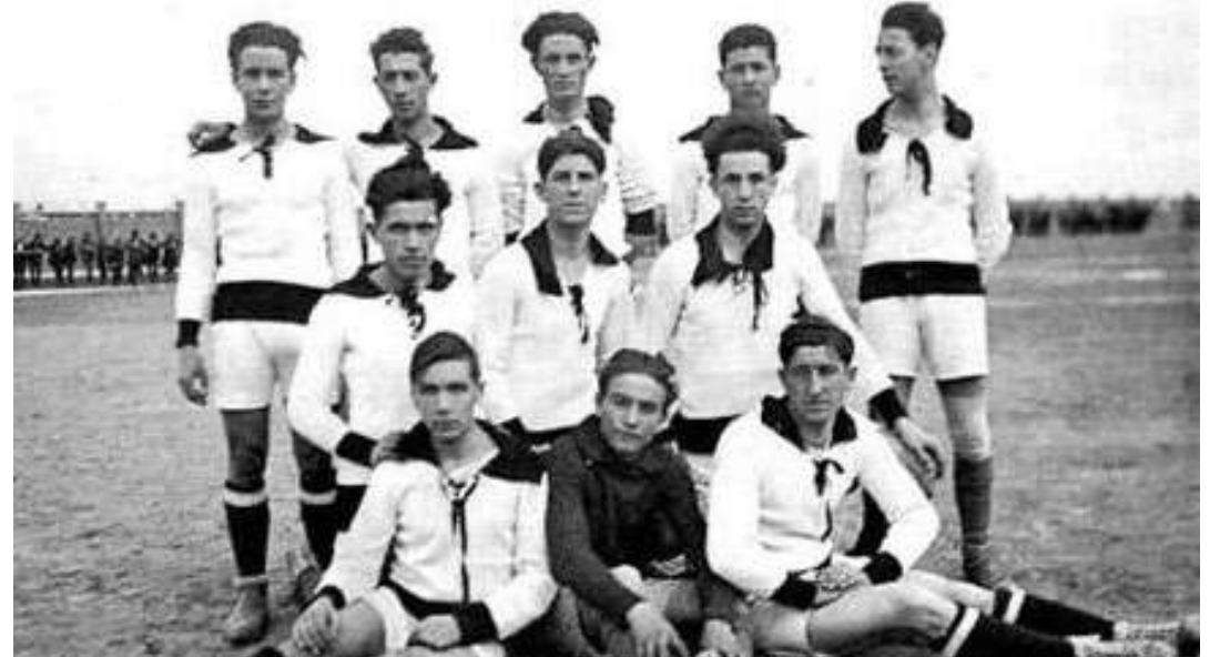
L'Udin dal 1922, squadre finaliste de "Coppa Italia"

La storie dal Udin e jere scomençade ancjemò ae fin dal 1800, te suaze de "Società Udinese di Ginnastica e Scherma", daspò diventade "Associazione Sportiva Udinese"