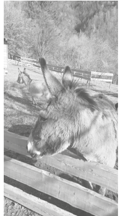
I DOI MUSSUTS

◆ “De place di Dimponç e partis la strade che intun minût ti mene in cheste localitât. – e continue