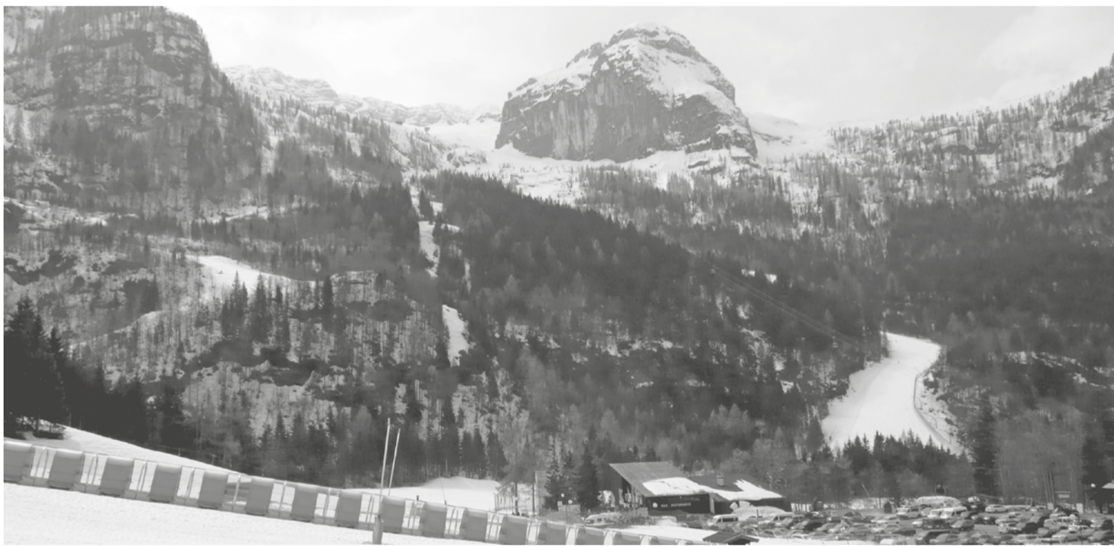
UNE FOTO DI NEVEE CON VIODUDE DEL CANIN. SOT, LA POCJE NÛF SUL FIANC DAL MONT SOT DE MALGHE GRANTAGAR

ANDAMENT SECOLÂR DE TEMPERATURE MEDIE ANUÂL A UDIN. DÂTS: SERIE HISTALP 1901-1991, OSMER-ARPAFVG-RAFGV 1992-2023. LIS LINIIS ROSSIS ORIZONTÂLS A MÔSTRIN LIS TEMPERATURIS MEDIIS TRENTENÂLS.