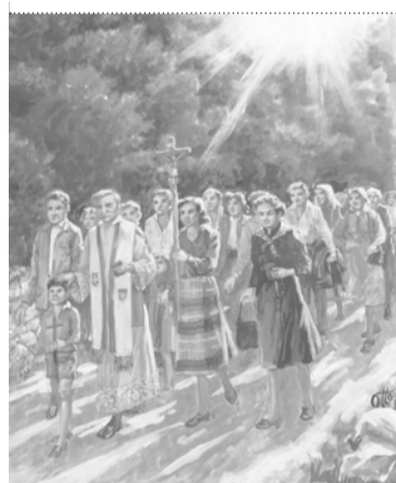
ROGAZIONI INTUN CUADRI DI OTTO D'ANGELO

Lis Rogazions a jerin processions cristianis dal timp de Vierte, fatis par domandâ il jutori celest su lis coltivazions e sul bon andament de anade agrarie. La prime Rogazion, clamade "Maiôr", si faseve ai 25 di Avril, invezeit chê "Minôr" si usave fâle tal lunis, martars e miercus prime de Sense – che e colave di joibe. Cheste procession si faseve tal vert de campagne, su percors antîcs che a tocjavin borcs sparniçâts te campagne, riui, croseris, gleseutis votivis, anconis e confins di país, par implorâ la protezion divine su la campagne coltivade e sui siei prodots che a stavin par dâ fûr. In