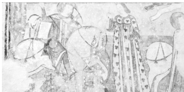
SANT ZORÇ TAL VÂT, FRONT DE GLESEIE

S tant ae tradizion cristiane, Sant Zorç al è stât un martar muart sot des muris di Nicomedie tal 303 e po dopo venerât di scuasit dutis lis Glesiis cristianis. Ancje lui al è un sant di riferiment stagjonâl, par vie che la sò fieste, celebrade ai 23 di Avril, e à cjapât sù funzions "segnaletichis" tal calendari de campagne, che a son compagnis di chês di Sant Marc (25-IV). Une volte, cu la fieste di San Zorç si inviave la stagjon dai pascui libars tes armentarecis e tai passons