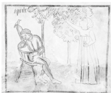
RAFIGURAZION DAL MÊS DI AVRIL TAL CICLI DAI MÊS, DI UN AUTÛR ANONIM (SEC. XVI), PITTURE A FRESC TAL ÇUCUL DE ABSIDE DE GLESEUTE DI SANT PIERI DI MAGREDIS DI PAULÛT

Començadis lis voris de campagne, il contadin al ten simpri di voli il cil intai siei cambiaments atmosferics, cetant impuartants pes coltivazions de anade agricule. Grant davoi intai vignâparfinilsvorisdi preparazion stant che cumò i vidiçs des vits a disgotin l'umôr, segnâl de gnove vite che e cor des lidris fintremai aes cecjis. Tai orts, preparâts e coltâts come zardins, lis feminis a rimplantin freulis e a preparin lis jechis pai sparcs, a semenin il basili e dutis lis verduris dal Istât come carotis, capûs, cauliflôrs e çucjis e te Basse furlane anguriis e melons. Tai zardins, netâts e ordenâts, si cuincin cjarandis e simpriverts, si incalmin piruçars e miluçars, si fasin lis leaduris aes plantis plui zovinis, si fasin taleis di ortensie e plantis autunâls, si metin sot tiere lis patatis des spadis e si cambiin di vâs lis begonias. ■