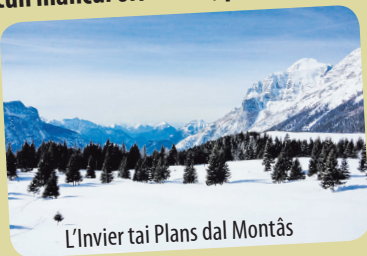
L'Invier tai Plans dal Montâs

■ Il 21 di Dicembar al è il dì di plui curt dal an, val a dî che e je la zornade cun mancul oris di lûs, par vie che il nestri emisferi al ricêf mancul lûs di bande dal Soreli. Cui 22 di Dicembar, vie pe zornade, lis oris di lûs si slungjin biel plancut. Savêso il non di chest moment dal an che al rapresente ancje il tacâ de stagion plui frede? Al è il Solstizi di Invier.