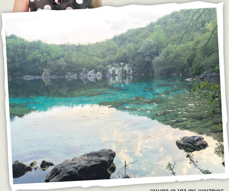
Soluzion: sul Lât di Curnin