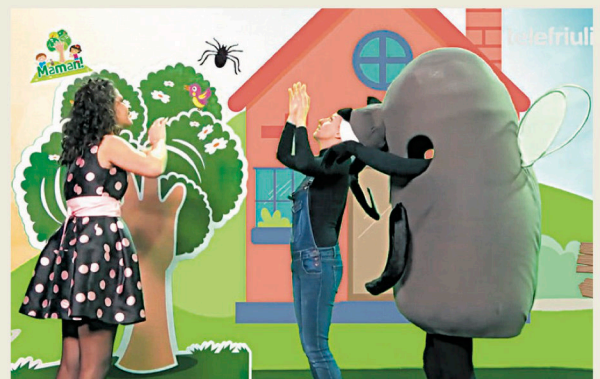
Soluzion: di un ragn

a) di une pavee b) di une âf c) di un ragn