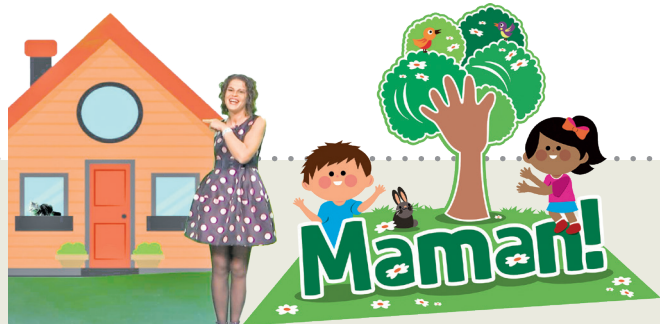
Proget promovût di 'Il Friuli' e 'ARLeF'