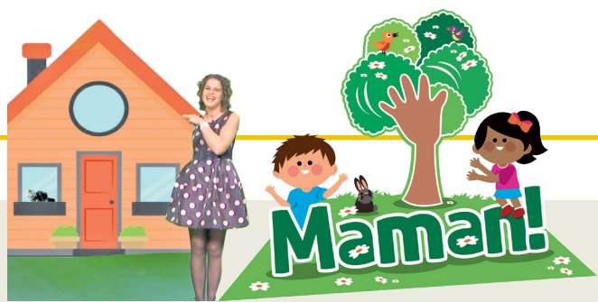
Proget promovût di 'Il Friuli' e 'ARLeF'