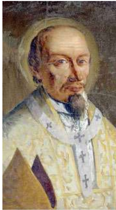
Paulin di Aquilee

La produzion poetiche pauline e veve colpît il Carducci pe sò ande di "poesie barbare", che e confaseve une vore ançe al poete des "Odi Barbare". L'imni su lis ruvinis di Aquilee al cjante il jevâsi sù pietôs dal lament dal poete su lis maseris di une citât sdrumade di plante fûr, une citât che un timp e jere potente e siore, e daspò colade in ruvinis, te suaze dal contrast di un splendôr passât e la miserie presinte. Secont Carducci, la distruzion e sarès succedude par man dal popul dai Avars tal 790 d.d.C., prime che al fos vinçût dal esercit di Pipin, e daspò di vè fiscât massime tal teritori di Aquilee. Ipotesi che e podarès vè une sò logjiche, par vie che Paulin al jere muart cualchi an dopo, e duncje al podeve vèle vivude in prime persone. Ma il patriarcje nol fevele propit tal poemut dai Avars, ma al pâr invezit, condurant la setime strofe dal imni, che si tratâs di Atila ("fremens ut leo Atila saevissimus"), che de fuide dai uciei de citât al veve gjavât i auspiciis par sburtâ lis