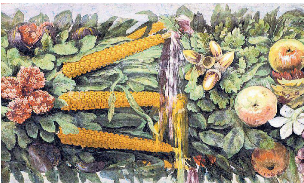
Particulâr di festons simpri di Zuan di Udin

ae fin dal XVI secul), Zuan al vierç la strade ae mode, di recupar classic, de piergule finte insiorade, come che al scrîf il Vasari, «stagione per istagione di tutte le sorti frutte, fiori e foglie con tanto artificio lavorate, che ogni cosa vi si vede viva e staccata dal muro». Vile Farnesina e fo progetade di Baldassarre Peruzzi e decorade di bande di artiscj di grande nomee tant che Raffaello, Sebastiano del Piombo, Sodoma. A vuê e je gjestide de Academie Nazional dai Lincei e vierte al public come museu. Cul fin ai 20 di Lui si pues viodi la mostre “I colori della prosperità: frutti del vecchio e nuovo mondo”, che e met in lûs propit il leam gjenial tra l'art di Raffaello e l'estri inventif di Zuan di Udin. Straordenari esempli di dialic tra architettura e afresc, la loze e la sô decorazion a son stadis pensadis insiem cul zardin ch'al è devant: un puest tant biel che Raffaello al à piturât la storie di Amôr e Psiche gjavade di Apuleio, li che lis figuris a son impuartantis come i festons di rosis e pomis che lis insuazin, piturâts invezit di Zuan. Oltri ae vivarose invenzion, insiorade dai colôrs vifs, la piergule finte e je straordinarie par vie des plantis rapresentadis, fintremai 170 varietâts ance je raris e esotichis, de blave cocis (o sin dome 20 agns dopo de scuvierie de Americhe). La