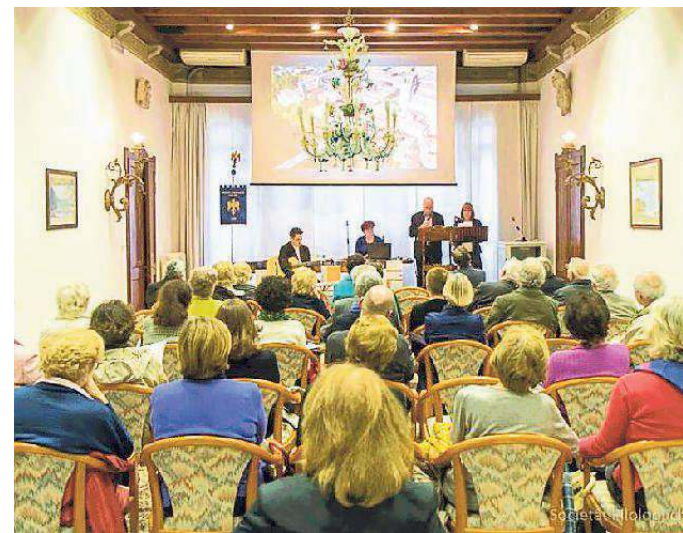
Una letture di art a Palaç Mantica te edizion 2016 de "Setemane"