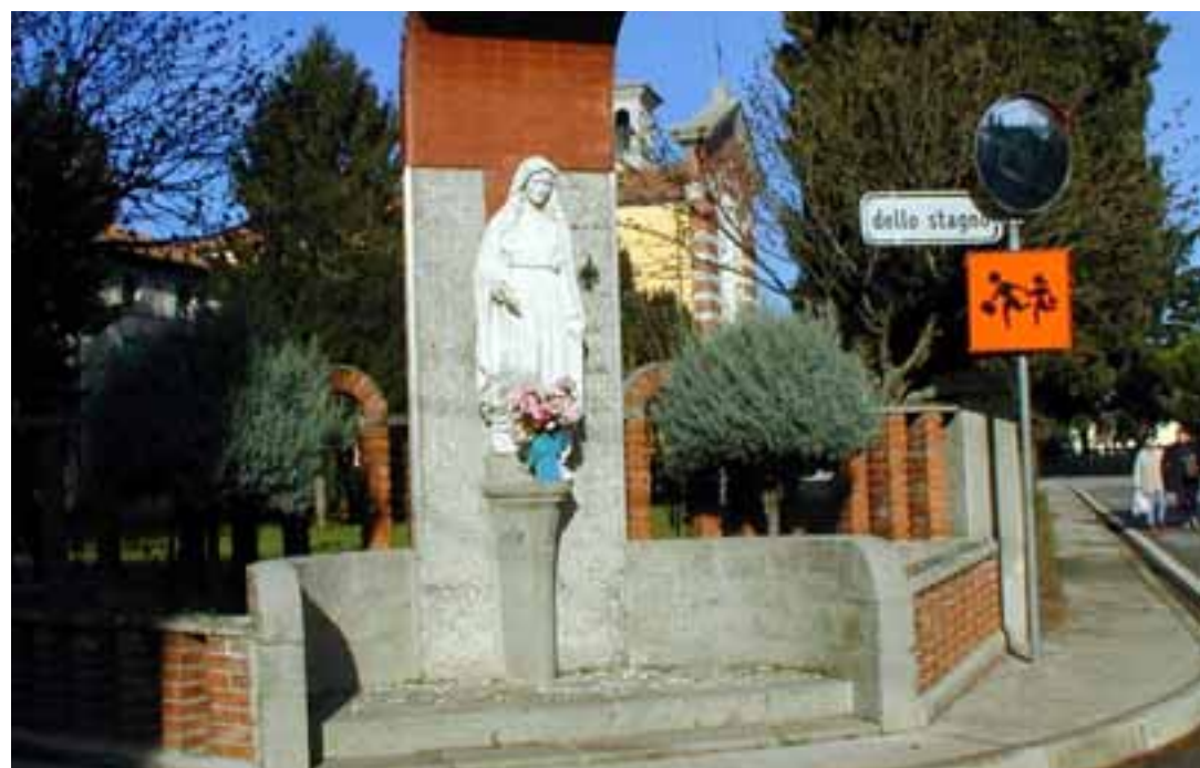
Capitel dedicât a Sante Sabide a Sant Andràt dal Cormôr in comun di Talmassons

E je une sante che no si cjate in nissun calendari, e che la Glesie no ricognòs il so cult. Cundut achel, e je stade venerade, par vie di une improvizion ecclesiastiche, par saeculorum, a scomençâ di quant che il cristianisim aquileiês al jere un frutin di tete, tra i fedèi des campagnis vie pe Basse – i "rustics" di pre Gjilbert Pressacco – che par jê a vevin fat sù gleseutis, capelis e mainis fintremai in Istrie, sot dal paronât di Aquilee. Dut al nas di un dinei, parie cul snait e cul nasebon che Vielm Biasutti al provave tal scrutinâ vielis cjartis di archivi, tant di vè butade li la ipotesi di une pussibile divignince dal primitif cristianisim di Aquilee di une çocje judaiche-alessandrine, tal timp dal imperadôr Justinian, cuant che Aquilee e Alessandrie dal Egipt a insioravin i lôr rapuarts e scambis cun chê part dal mont di Orient. Un rapuart che o podin lei ançe come stratificazion depositade di trê origjinalis variants teologjichis dal Simbul, compagnadis di costumes e di usancis, come chê de polse de sabide, che i contadins – i rustics des campagnis dulintor di Aquilee – a praticavin cun osservance, vuardantsi ben dal lavorâ i cjamps te zornade di sabide, e lavorant di domenie, cuant che chei di citât, invezi, a osservavin la polse dal "dies Domini". Si viôt che chesto usance si jere slargjate, tra i rustics, se il patriarce Paulin, vie pal Concili provinciâl di Cividât dal 796,