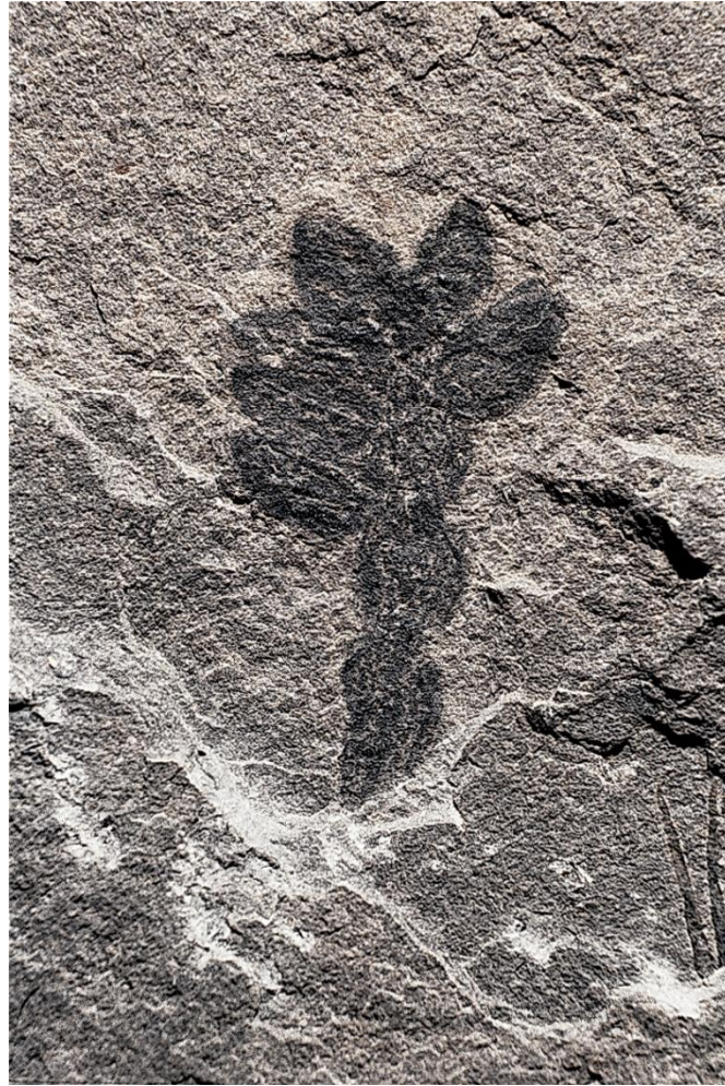
Museu Furlan di Storie Naturâl