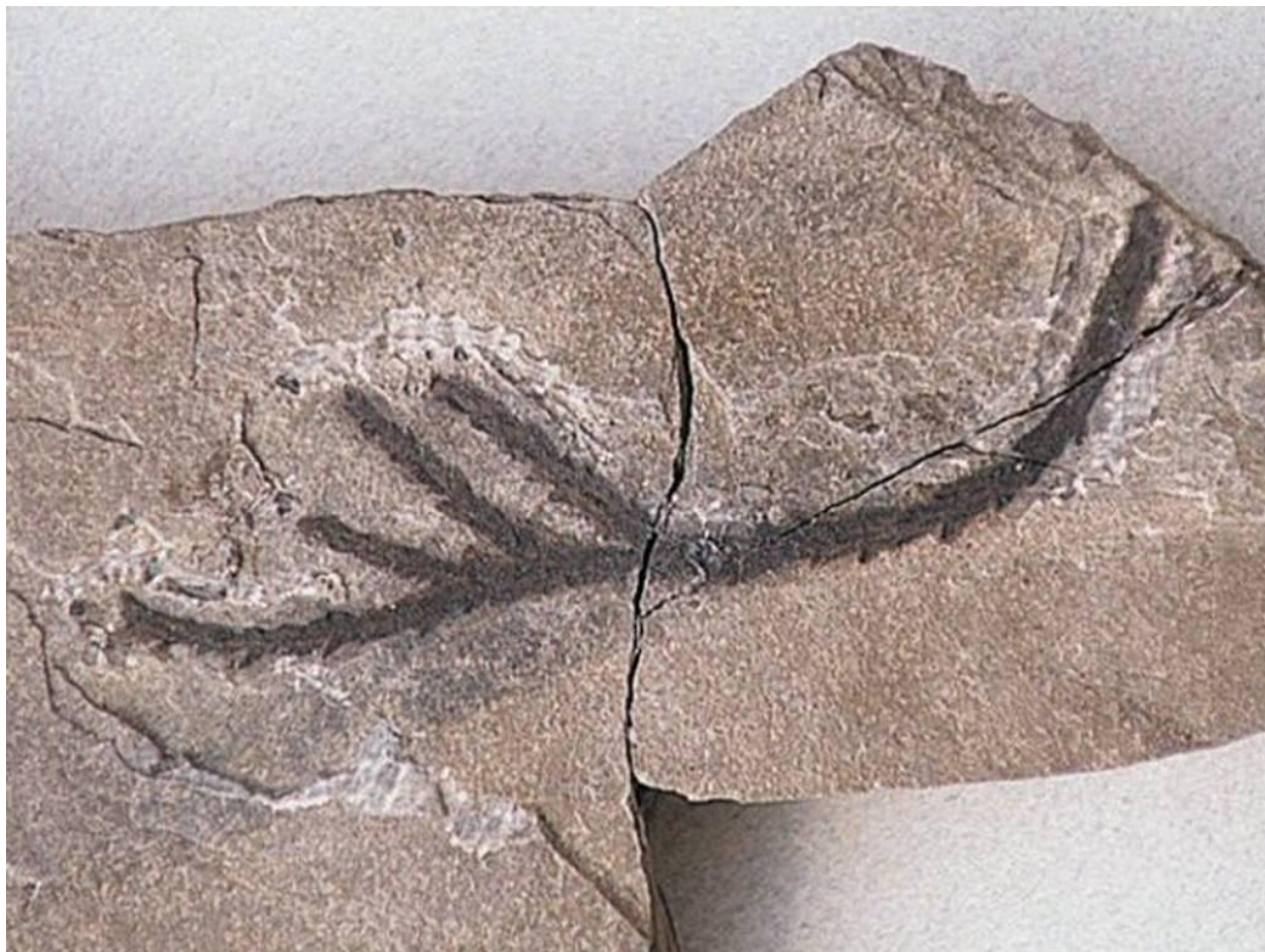
Coleç Salesian di Tumieç