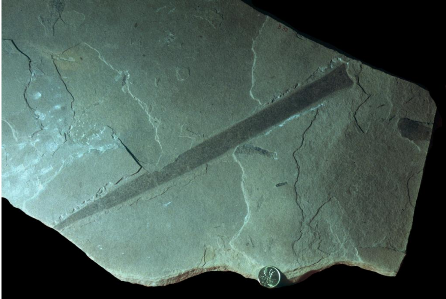
Museu Furlan di Storie Naturâl